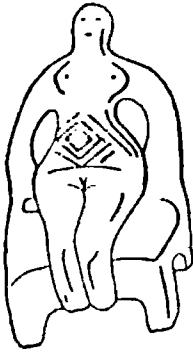
2.27. Женское изображение эпохи энеолита